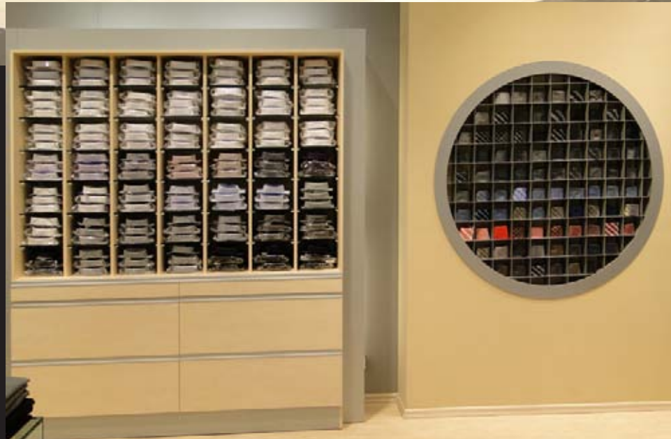
Wysmakowane funkcjonalne wnętrze