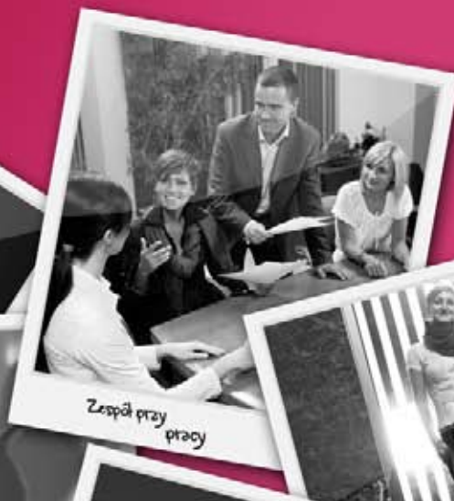
Zespół przy pracy